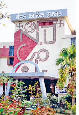
झज्जर। राजकीय स्नातकोत्तर नेहरू महाविद्यालय भवन का फोटो।