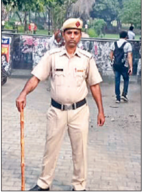
बहादुरगढ़। सुरक्षा की दृष्टि से पार्क में तैनात होम गार्ड।