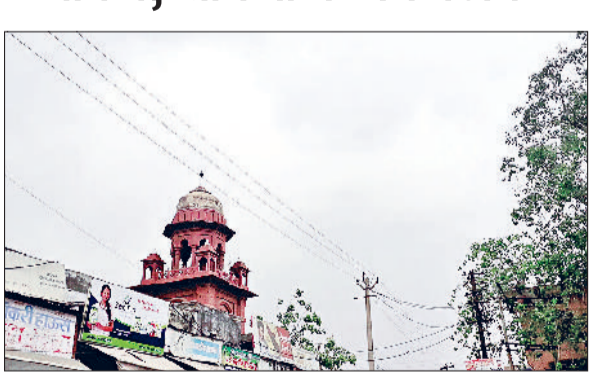
झज्जर। आसमान में छाए काले बादल।

झज्जर। शुक्रवार दिन की शुरूआत आसमान में छाए काले बादलों और ठंडी हवाओं के साथ हुई। बाद में भी दिनभर आसमान में बादल छाए रहे और हवाएं चलती रही। जिसके कारण तापमान में गिरावट दर्ज की गई और लोगों को गर्मी से आंशिक राहत भी मिली। लेकिन बरसात नहीं होने कारण लोगों के हाथ मायूसी लगी। लोगों का कहना रहा कि अगर बारिश होती