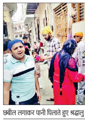
छबील लगाकर पानी पिलाते हुए श्रद्धालु।