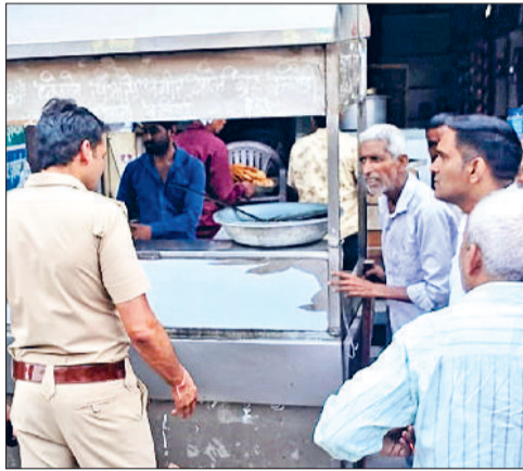
बहादुरगढ़। अतिक्रमण हटवाती पुलिस व दुकानदारों को समझाते अधिकारी।