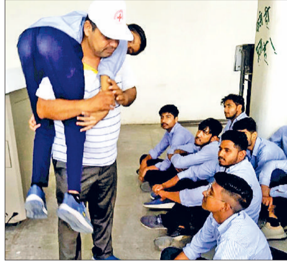
बहादुरगढ़। कैंप में फर्स्ट एड के बारे में जानकारी देते रेडक्रॉस के कर्मचारी।