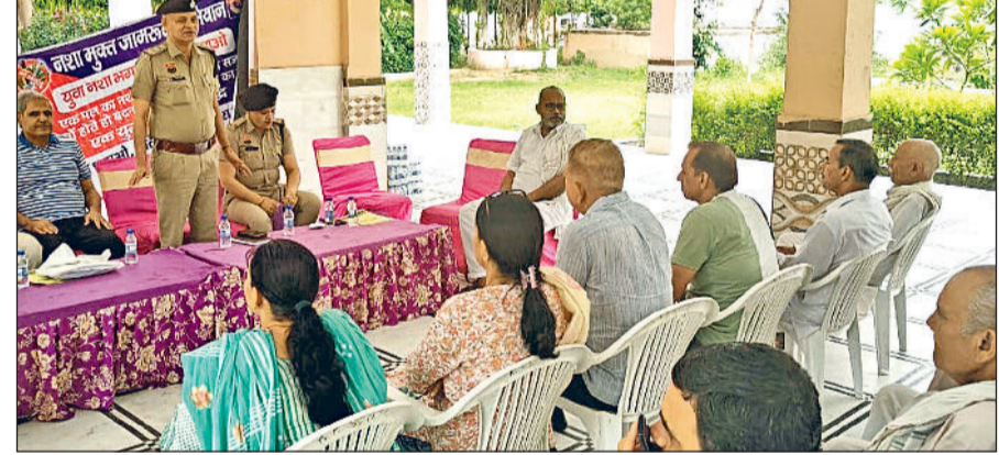
बहादुरगढ़। ग्रामीणों को जागरूक करते पुलिस अधिकारी।