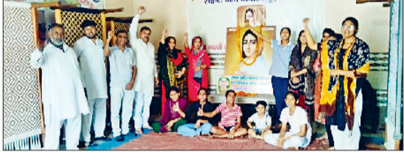
इज्जर। कार्यक्रम के दौरान उपस्थित प्रबुद्धजन एवं बच्चे।