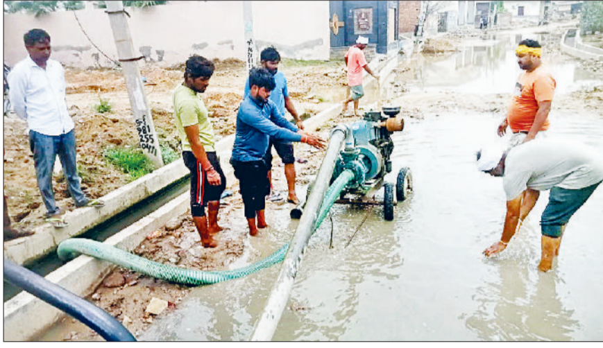
झज्जर। पानी निकासी की व्यवस्था करते हुए कर्मचारी।