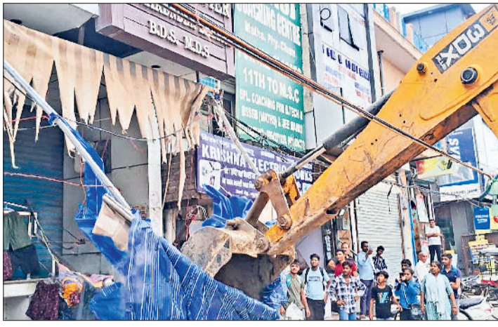
बहादुरगढ़। अतिक्रमण को हटाती जैसीबी।